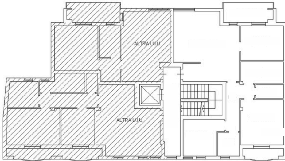
PIANO PRIMO H 2,70